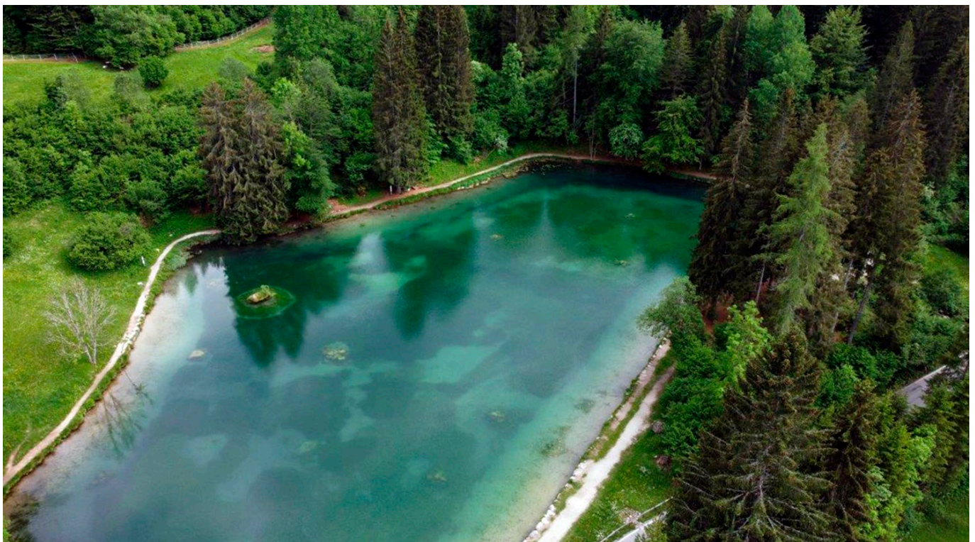
Fig. 2 – Dettaglio dell'ambiente in cui sono avvenute le osservazioni. / Fig. 2 – Detail photograph of the habitat/surroundings in which the observations (of the polecat) took place.

La puzzola, pur potendo frequentare ambienti molto diversi, ha una preferenza per le zone umide (Rondinini et al. 2006). In Val Canali nell'ultimo decennio sono stati realizzati una serie di interventi di miglioramento ambientale, con la riqualificazione del Laghetto Welsperg e delle torbiere circostanti (Fig. 2). Tali azioni