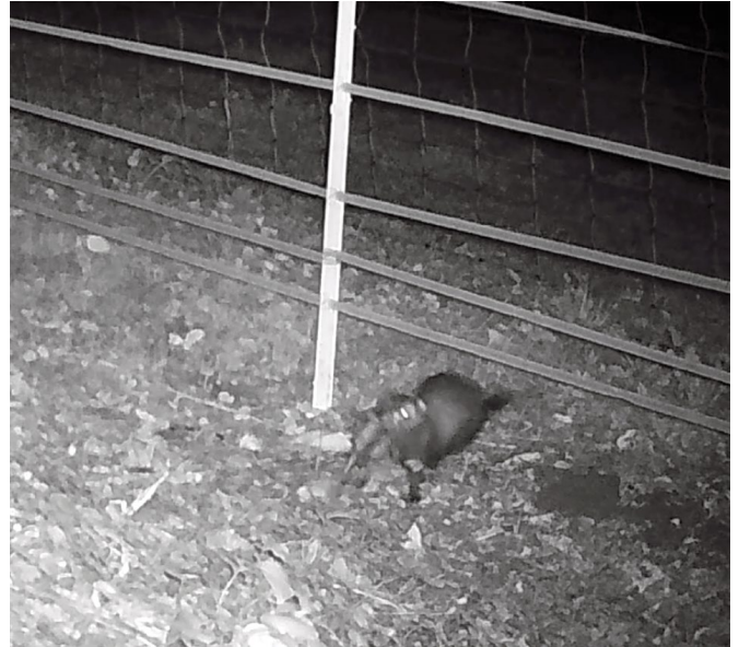
Fig. 1 – Fotogramma di puzzola di uno dei filmati ottenuti nel 2022, in Val Canali. / Fig. 1 – Photogram showing the polecat obtained from one of the video sequences recorded in Val Canali in 2022.

Tra la fine di agosto e la fine di settembre 2022 sono stati acquisiti cinque filmati di un mustelide di medie dimensioni. Nel filmato più significativo l'animale porta anche una preda. L'attenta analisi del materiale videoregistrato ha permesso di attribuire quattro dei filmati alla specie puzzola (Fig. 1) e di accertare la presenza di almeno due diversi individui.